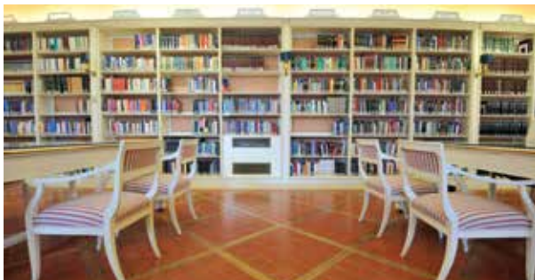
Saal der ausländischen Gesetzgebung

Sie organisiert regelmäßig bibliographische Ausstellungen und, in Zusammenarbeit mit anderen interessierten Anstalten, Besuche des dominikanischen Gebäudekomplexes der Minerva ( Insula sapientiae ).