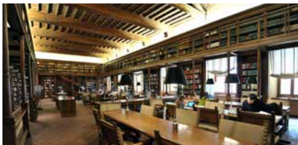
Sala delle Capriate (Dachbindersaal)

Mit den 22.000 Bänden ihrer Sammlungen wurde sie 1871 im zweiten Stock des Palazzo Montecitorio im Sitz der Kammer des Neuen Königreichs Italien untergebracht, wo sie bis Dezember 1988 blieb, als sie für das Publikum geöffnet und ins Gebäude an der Via del Seminario im alten Dominikanerkloster Santa Maria sopra Minerva verlegt wurde.