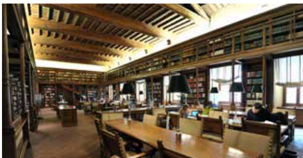
Sala delle Capriate (Salón de las Armaduras de Cubierta)

En 1871 , con los 22.000 volúmenes de que constaban sus colecciones, encontró acomodo en la segunda planta del palacio de Montecitorio , en la sede de la Cámara del nuevo Reino de Italia, donde permaneció hasta diciembre de 1988 , cuando se abrió al público y se trasladó al Palacio de Via del Seminario , en el área del antiguo convento dominico de Santa Maria sobre Minerva.