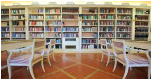
Sala de la Legislación Extranjera

Realiza periódicamente exposiciones bibliográficas, así como visitas al complejo de los Dominicos de la Minerva ( Insula sapientiae ), en colaboración con las demás instituciones implicadas.