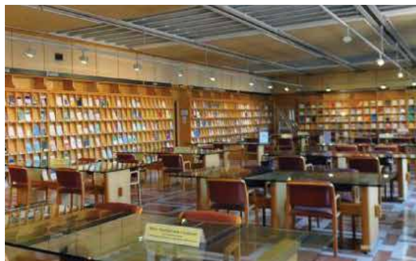
Sala de Revistas