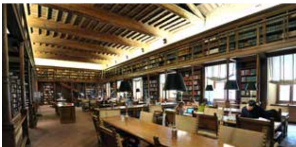
Sala delle Capriate (Salle des Chevrons)

En 1871, avec les 22 000 volumes de ses collections, elle fut installée au deuxième étage du Palais Montecitorio au siège de la Chambre du nouveau Royaume d'Italie, où elle resta jusqu'en décembre 1988, date d'ouverture au public et du transfert au Palais de Via del Seminario , dans l'aire de l'ancien couvent des dominicains de Santa Maria sopra Minerva.