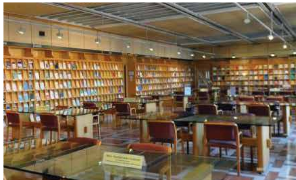
Salle des périodiques