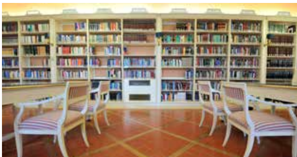
Salle de la législation étrangère

Elle organise régulièrement des expositions bibliographiques, ainsi que, en collaboration avec d'autres organismes intéressés, des visites du complexe dominicain de la Minerva ( Insula sapientiae ).