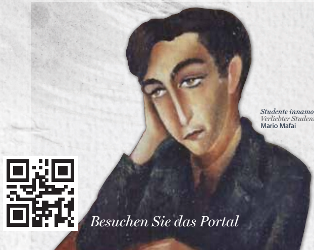
Studente innamorato Verliebter Student Mario Mafai

Das Portal zum künstlerischen Bestand der Abgeordnetenversammlung